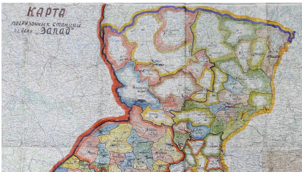
Карта вантажних станцій на Рівненщині у справі "Операція "Захід"

"Селяни оточили машини, які мали вивозити людей, і сказали, що не пустять з села. І тільки коли почали застосовувати зброю і стріляти по верх голів з автоматів — тоді тільки розступилися, розбіглися. Начальники конвою відмовлялися брати малолітніх дітей, бо розуміли, що з ними клопіт буде в дорозі. І матір зі старшими дітьми забирали, а дітей 2-3 років лишали.