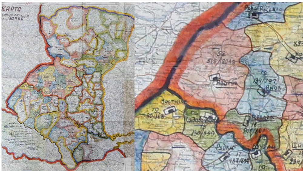
Карта вантажних станцій у справі "Операція "Захід"

Він додав, що усе відбувалося "цілком таємно" і за всіма правилами військової операції.