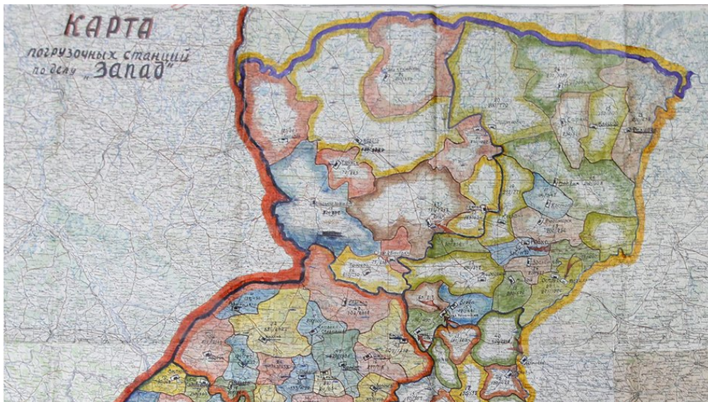
Карта вантажних станцій на Рівненщині у справі "Операція "Захід"

"Селяни оточили машини, які мали вивозити людей, і сказали, що не пустять з села. І тільки коли почали застосовувати зброю і стріляти по верх голів з автоматів — тоді тільки розступилися, розбіглися. Начальники конвою відмовлялися брати малолітніх дітей, бо розуміли, що з ними клопіт буде в дорозі. І матір зі старшими дітьми забирали, а дітей 2-3 років лишали.