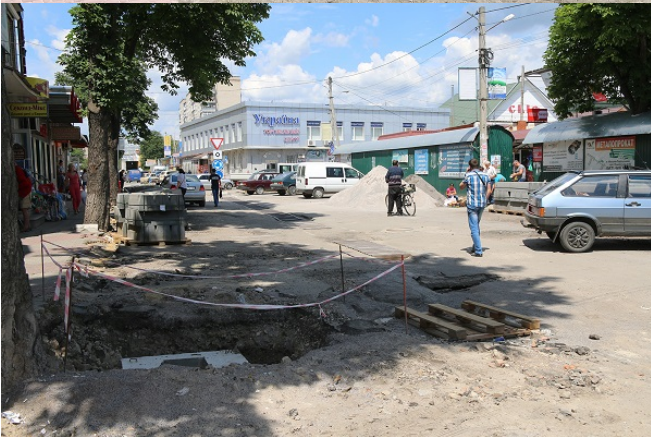
"Краяни" №27 від 05 липня 2018 року